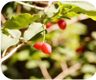
ウグイスカグラの赤い実 (食べられる・甘い)