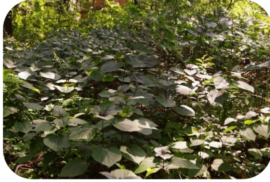
クサギが明るくなった林内に一斉に咲きました