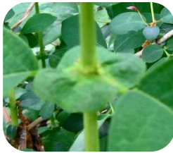
神楽の舞台と 言われている 葉の付け根部分