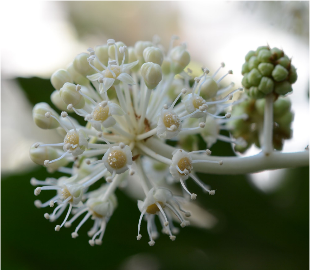
ヤツデ（ウコギ科） 雄性期の花。花弁5、雄しべ5