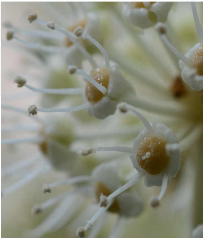
雄性期。黄土色の部分は花柱の基部の柱下体