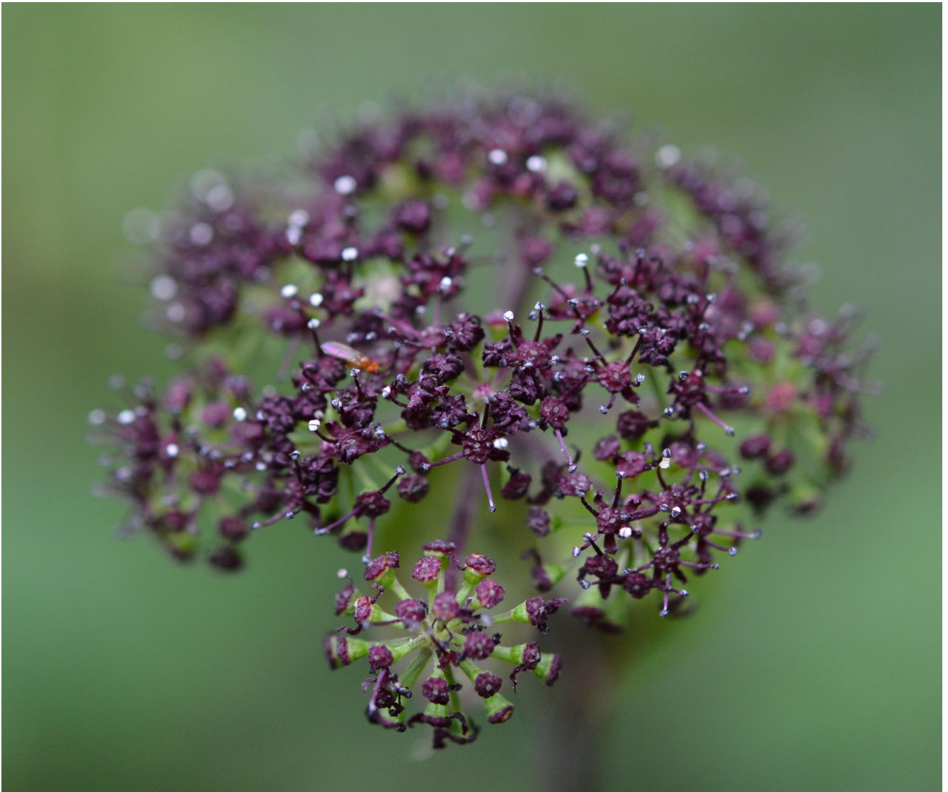
ノダケ（雄性期の花）