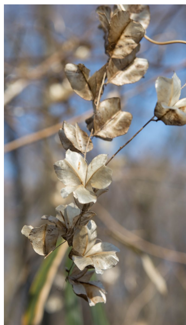
オニドコロ 種子が出た後の果実の翼