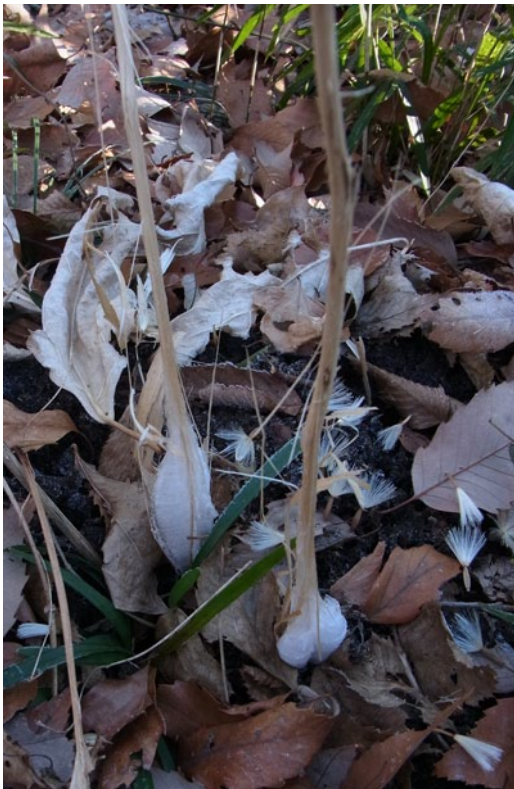
カシワバハグマの根元に できた霜柱

花後。花のように見えるのは総苞で、魚の骨のようなのは苞葉です。羽毛状の枝がある冠毛のついた果実が少し残っています。