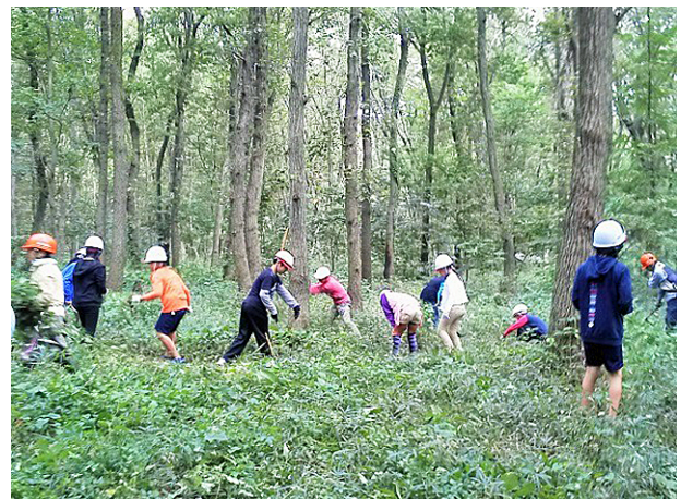
大野台中央小生徒の体験授業