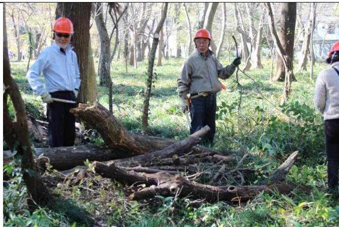
落枝を拾い、下草刈りに備える