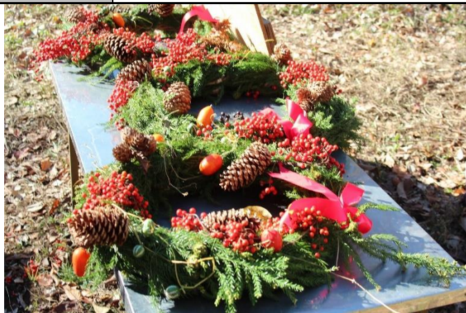
森の3か所に飾ったXmas リース、見つけられるかな？