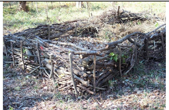
次の植樹に向け、伐木した端材で堆肥場を拡張した