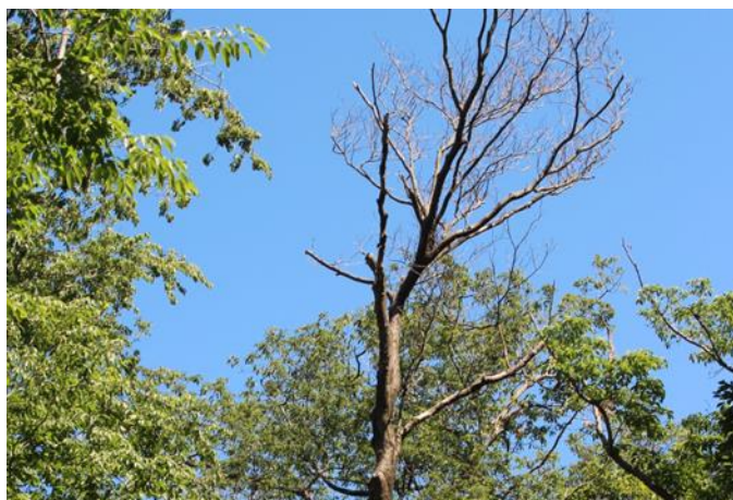
若葉に恵まれず、立ち枯れしているのので伐木処理した