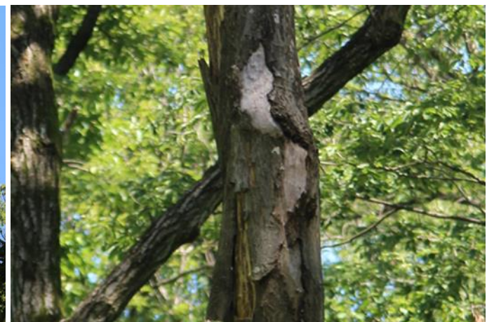
樹皮が崩れ落ちている様子 (左と同じ木)

次回の予定：定例活動9:00~ 6月3日 (土) イヌシデ広場集合 6月10日 (土) イヌシデ広場集合 イベント： 6月10日 (土) 企業CSR活動支援 ☆ボランティア募集・経験不問☆ 第1 土曜、2 土曜、3 日曜、4 水曜 好きな日の午前に参加可。活動日の朝9:00前に長袖で来て下さい。