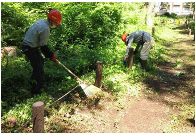
下草刈りは、秋まで継続する