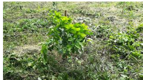
植樹苗は下刈りしてもらい気持ちよさそう。