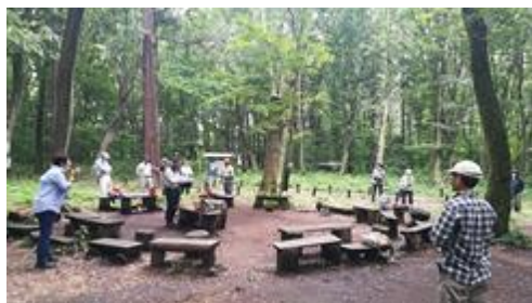
今日の作業内容と注意事項説明