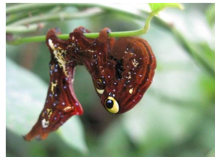
アケビコノハ幼虫