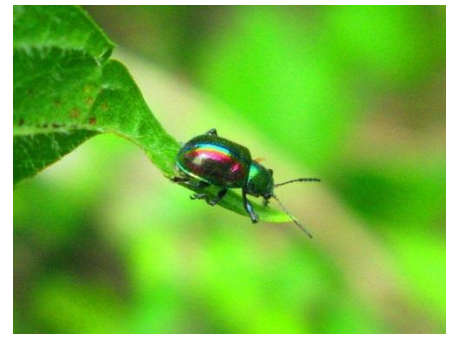
アカガネサルハムシ