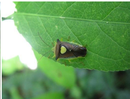
エサキモンキツノカメムシ