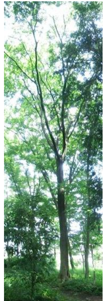
大野台地区にある エノキの高木

ところで世界最高の高い木はアメリカカリフォルニア州レッドウッド国立公園で発見されたコーストレッドウッド(セコイア)でその高さは115, 2メートルもあるが、山奥にはそれよりも高い木があるといわれています。(林)