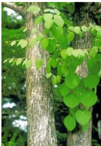
カツラの樹皮と葉

エノキは昔、街道に一里ごとに植えられ、そこには旅人の休息の茶屋があったといわれています。今もその名残りの大木を見ることができます。雑木林の周辺でもよく見かけられます。