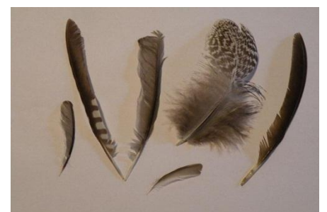
森で拾ったフィールドサイン