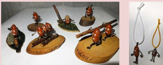
(NPO法人相模原こもれび 販売品)